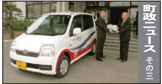
町政ニュース その三

加入手続きは、お住まいの市区町の国民年金担当係です。学生で在学期間中の保険料の納付猶予を希望される人には、「学生納付特例制度」もあります。詳しくは住民生活課年金係(☎36-3311内線232)までお問い合わせください。