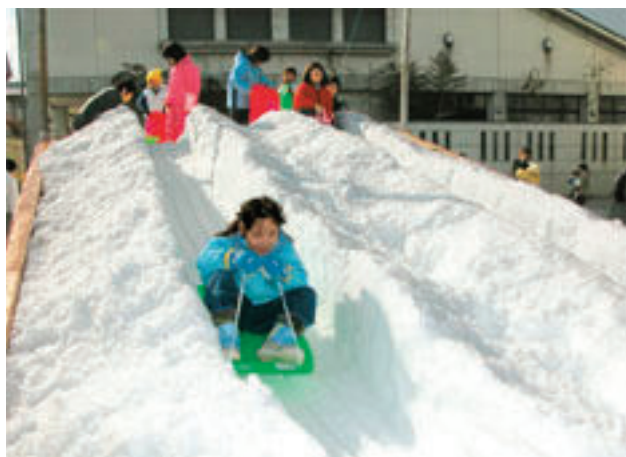
▲ソリ滑りを楽しむ子どもたち

会場は、機械で降らせた雪で銀世界に。子どもたちは白い雪に歓声を上げ、ソリ滑りや雪だるまづくりなど、雪遊びを満喫しました。